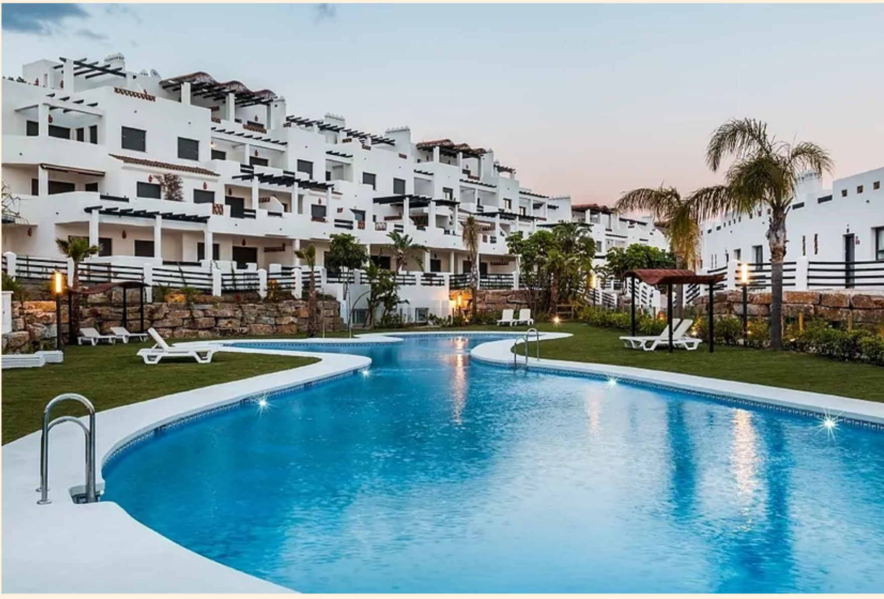
Urbanización Sunset golf de Avellanar. EXPANSIÓN

Trabaja en proyectos en el barrio de las Letras y La Moraleja, en Madrid, y en la Costa del Sol. En los últimos siete años ha desarrollado más de 1.000 activos inmobiliarios en el país.